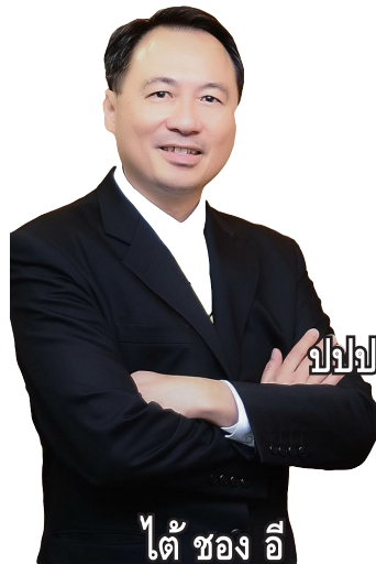
ได้ ชอง อี้

ช่วงนี้ใครๆ ก็เก็บตัว #อยู่บ้านหยุดเชื้อเพื่อชาติ เพื่อให้เราผ่านพ้นสถานการณ์นี้ไปด้วยกันโดยเร็ว น้อง #กล้วยกรุงศรี ก็เช่นกัน แต่ล่าสุด #กล้วยกรุงศรี โผล่มาทักทายด้วยคอนเซ็ปต์#อยู่บ้านก็สนุกได้ง่ายๆ นะพร้อมปล่อยพลังโซเชียลล่าสุดทวนให้ทุกคนได้ออกกำลังกันชวนแฟนฯ ซ้อมเต้น 5 ท่าลีลาทวนๆ และทำวอลเลย์กัน เป็นกิจกรรมสนุกๆ แบบบ้านใครบ้านมันก็มันส์ได้ งานนี้แอบเข้าไปดูคลิปแล้วบอกได้ว่าท่าเต้นไม่ยาก แต่อินเนอร์ต้องมาไปวอลเลย์กันกับกล้วยกรุงศรีกันได้ที่ Tiktok @krungsribanana #อยู่บ้านก็สนุกได้ง่ายๆ นะ : https://vt.tiktok.com/rSRDGW/ https://pic.twitter.com/V8tvTPYbEE